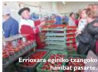
Errioxara eginiko txangoko hainbat pasarte.

Oraingoan ere ezin urtea amaitu Errioxa aldera bisita egin gabe. Bizi Nahi elkartetik Lodos –Azagar– Lodos txangoa antolatu genuen urriaren 28rako, eta 55 lagunek eman genuen izena. Lodosan piper festa ikusi ondoren, Azagara bazkaltzera joateko bidean upategi bat bisitatu genuen. Egun paregabea egin zigun, eta guk ere ezin hobeto pasatu genuen.