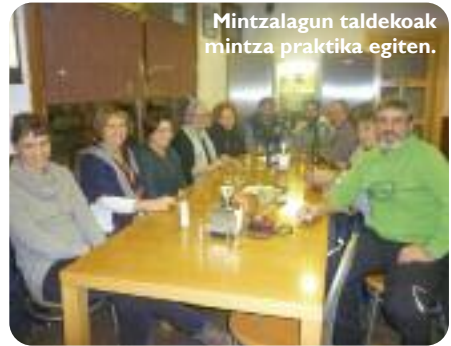
Mintzalagun taldekoak mintza praktika egiten.