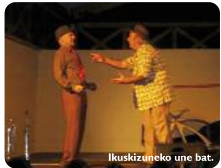
Ikuskizuneko une bat.

Musika, dantza eta umorea tartekatuz, bi artistek ordubeteko ikuskizun aparta eskaini zuten, bertan elkartutako guztion gozamenerako. ■