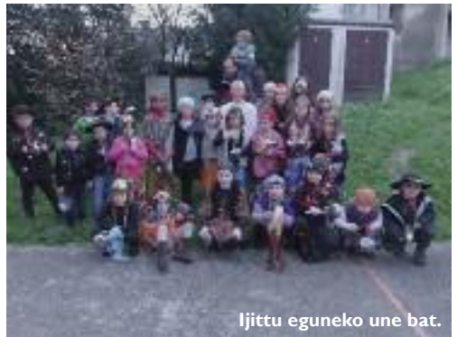
Ijittu eguneko une bat.