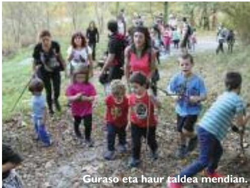
Guraso eta haur taldea mendian.