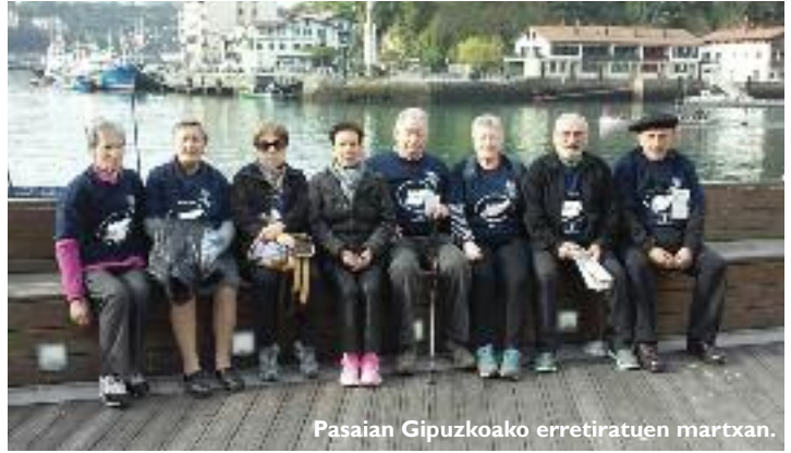
Pasaian Gipuzkoako erretiratuen martxan.