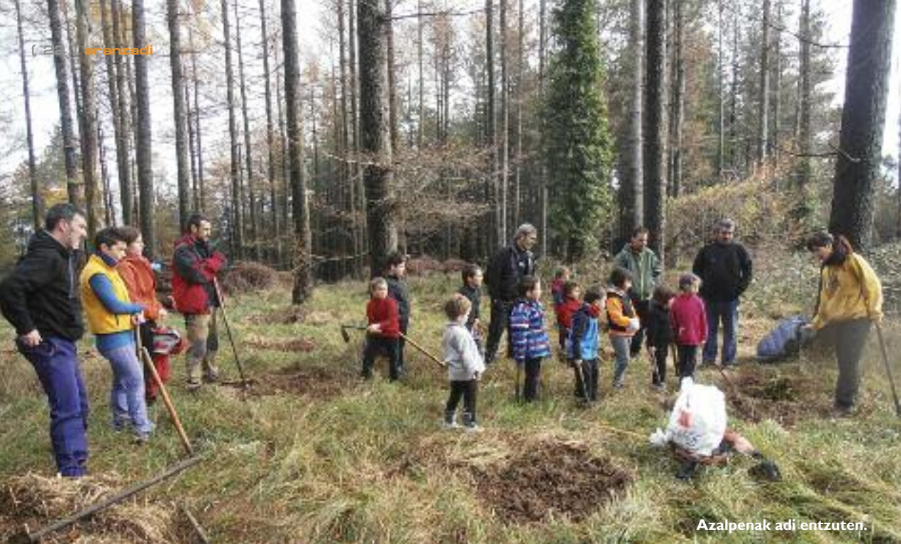
Azalpenak adi entzuten.