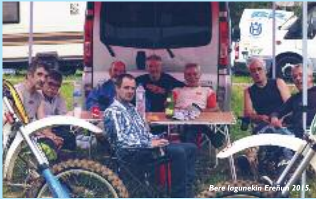
Bere lagunekin Ereñu 2015.