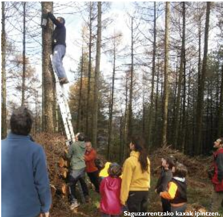
Saguzarrentzako kaxak ipintzen.

Azaroko auzolanaren bitartez, balio horiek herritarren artean zabaldu nahi izan ziren, bide batez herritarrak mendiko lanetara gerturatu eta horiek baloratzen ikas dezaten. Ezin dugu ahaztu, gainera, antzinatik datorkigun ohitura honek herritarren arteko harremanei dakarkien onura: lan giro atseginean gure arteko harremanak sendotzen ditugu askotan, gero eta ahaztuago daukagun talde sentimendua indartuz. Auzolan honetan, ume zein heldu, 20 bat lagunek parte hartu genuen. MILA ESKER GUZTIOI ETA HURRENGORA ARTE! ■