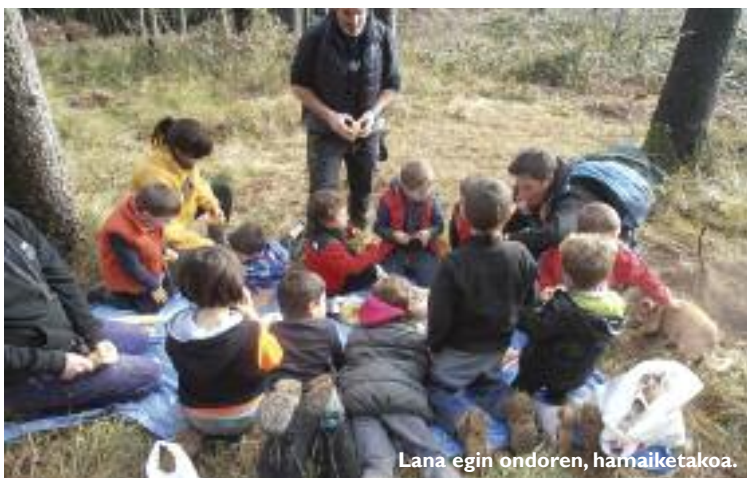
Lana egin ondoren, hamaiketakoa.