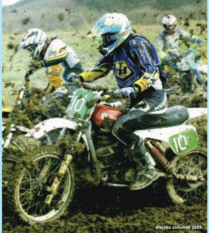
Altzako zirkuitoa 2009.