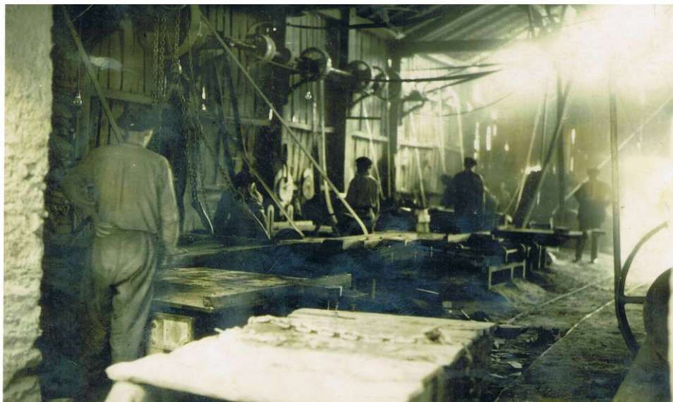
Sarasolatarren lantegietako bat. ITSASONDOKO UDAL ARTXIBOA, sig. 329