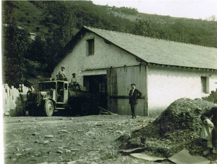
Kamioiak Sarasolatarren fabrian. ITSASONDOKO UDAL ARTXIBOA, sig. 329

Produktuak, trenez ez ezik, kamioiez ere ateratzen ziren udalerritik; 1950eko hamarraldiaz geroztik izan zuen garrantzi gehien errepide bidezko garraioak. Era horretara, ekoizpenaren parte bat Bartzelonara eramaten zen, baina baita Zaragoza, Valladolid, eta abarretara ere; Pasaiako portua ere produktuen banaketa gune garrantzitsua izan zen garai batean, bereziki espainiar kolonietara bidaltzen ziren produktuei zegokienez (Gineako kakao txigortegiak...) 179 .