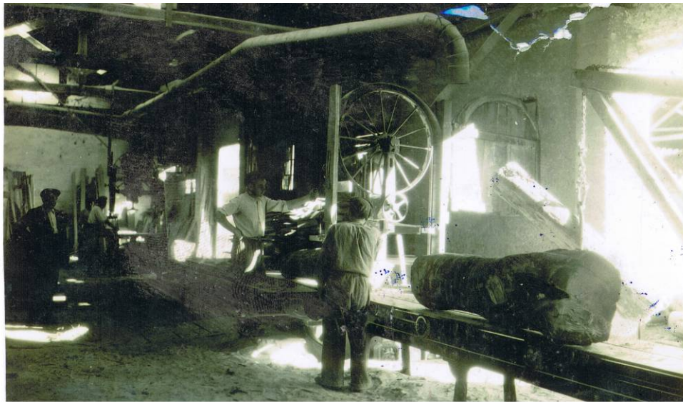
Zerratokia, ITSASONDOKO UDAL ARTXIBOA, sig. 329

Tailerretan egur-biltokiak eta zerratokiak izaten zituzten, eta haietan markoak egiten ziren, eta baita produktuentzako kutxak eta bilgarriak ere. Zerratokietan, markoak egiteko, lau zerra mekanikotatik (lehenen handiena) igaroarazten ziren egurrezko enborrak, behin betiko forma eta tamaina eman arte 172 . Markoen piezak, mihiztatuak, tupien bitartez ahokatzen ziren 173 , nahiz eta lehenengo urteetan eskuz muntatzen ziren 174 .