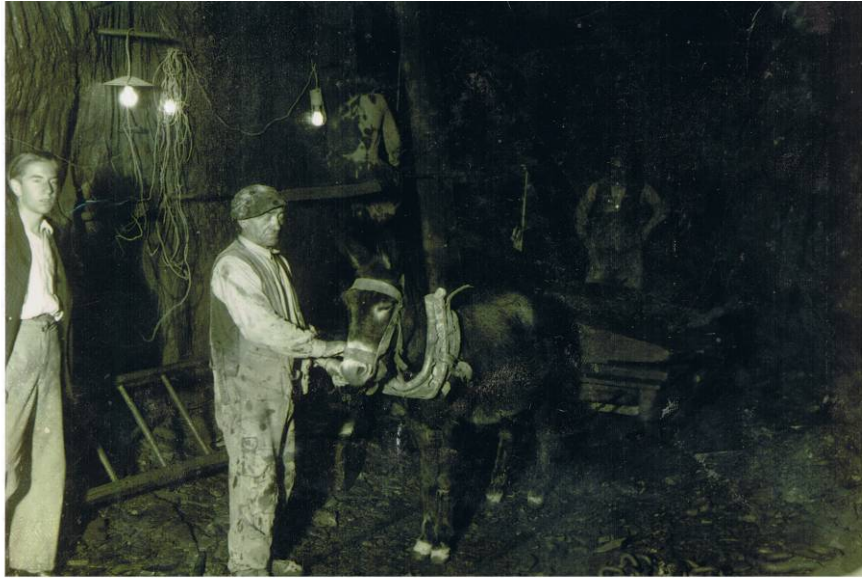
Sarasolatarren meategiak. ITSASONDOKO UDAL ARTXIBOA, sig. 329