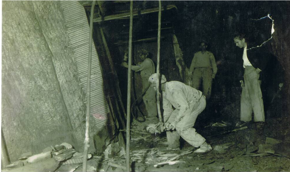
Mailu pneumatikoen erabilera metategietan. ITSASONDOKO UDAL ARTXIBOA, sig. 329

20ko hamarraldian, ordea, meatzeetan mailu pneumatikoak erabiltzen hasi ziren. Era horretara, asko arindu zen meatzarien lan gogorra, baina horrek beste arazo bat ekarri zien enpresaburuei: energia elektrikoa eraman behar zen meatzeetara, tresna berriak ibiliko baziren. Arazoari irtenbidea emateko, meatzeen sarreratan konpresore-etxeak eraiki ziren; eta han jarri ziren lurrunezko makinak, generadoreei elkartuta, beharrezkoa zen elektrizitatea sortzeko. Instalazio horien bitartez osatu ahal izan zen 30eko hamarraldia arte enpresek Oria ibaiaren alboko zentral hidroelektriko txikietan ekoizten zuten energia. Zentral haien arazoa ur-jauzien altuera txikia zen, eta, horregatik, sekzio handiko turbinak behar ziren; gainera, oso produktibitate txikia zuten agorraldietan 145 . Gerra Zibilaren ondoren, eta gerraostean erregai gutxi zegoenez, gas pobreko motorrak sartu ziren instalazio horietan.