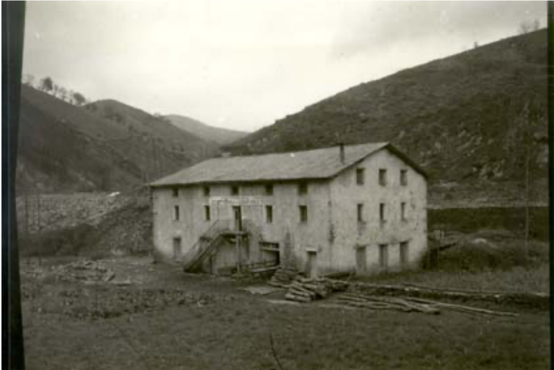
Echeverría, Luluaga y C. a (gero Altuna y C. a izango zena).