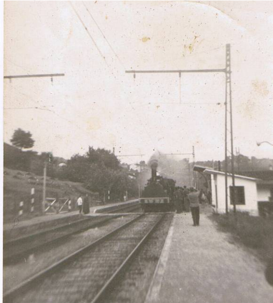
Itsasondoko geralekua. ITSASONDOKO UDAL ARTXIBOA, sig. 329

Trenbidea funtsezkoa izan zen Itsasondoko arbelgintzaren garapenean, bai salgaiak garraiatzeko bai Itsasondora iristen ziren langileei meatzetara eta lantegietarako garraioa errazteko. Langileen garraioari dagokionez, Iparraldeko Trenbidea linearen bi gunerabakigarriak izan ziren Itsasondoren historia industrialean: Ordiziako geltokia eta Itsasondoko geralekua.