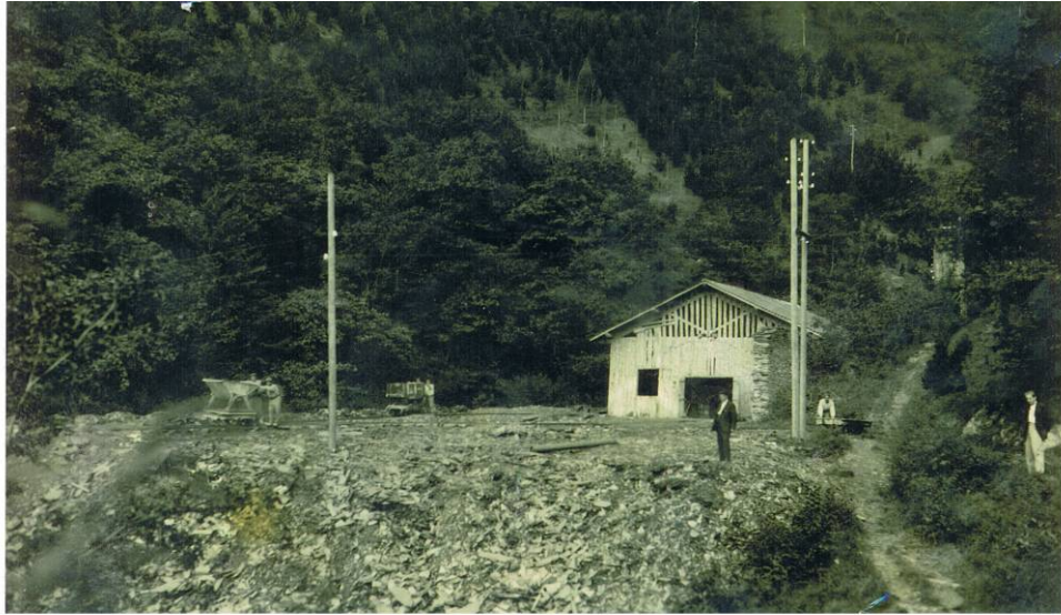
Sarasolatarren Fabrika Zaharra, Izarren.