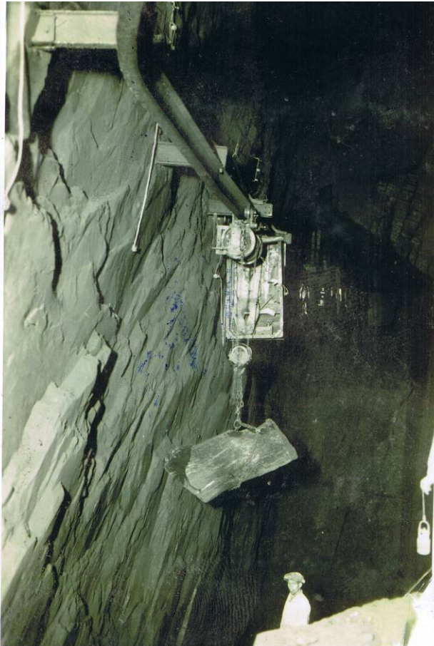
Meategietako garabiak.

eskuzko zerren bitartez lehenengo ebakiak egin zitzaten 147 . Horrela, prestatuta uzten ziren, angelu zuzenean zerratuta, erlaitzetarako, pixatokietarako edo billar-mahaietarako pieza handiak; izan ere, arbela taulatan zatitzeko, arbelak atera berria izan behar zuen, eta fresko egon behar zuen. Pieza handi haietatik askatzen ziren zatiak lauzetarako erabiltzen ziren, eta zerra biribil batez ebakitzen ziren 148 .