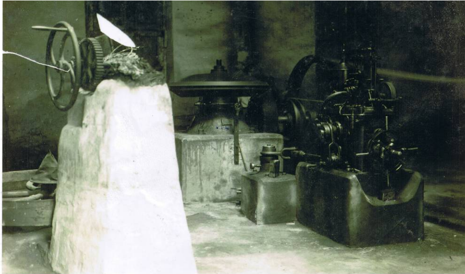
Sarasolatarren tailerretako makina batzuk. ITSASONDOKO UDAL ARTXIBOA, sig. 329