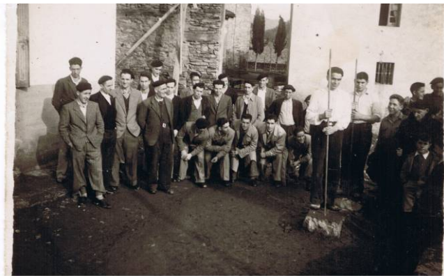
Meataritzak ohituretan eta herriko jaietan ere utzi zuen bere aztarna. ITSASONDOKO UDAL ARTXIBOA, SIG. 329

Arbela erauzteko eta manufakturatzeke lanei loturiko industria-jarduerak Itsasondon utzi duen arrastoa begien bistakoa da gaur egun, XXI. mendearen lehenengo urteetan, azken arbeldegia itxi zenetik hainbat hamarraldi igaro direlarik. Itsasondoren historia arbel-enpresei lotuta dago, zalantzarik gabe; arbel-meategietako eta -lantegietako lanak eman dio forma udalerrinari, eta jarduera horren arrastoak bertako kale eta mendietan ikus daitezke, oraindik.