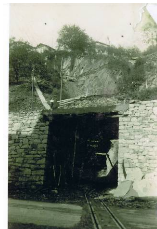
Mendibilgo gaztelua eta Beheko Zuloa.

Meatzeetako ustiategia gaztelu baten bitartez lotzen zen ibarraren hondoko manufakturrekin, eta gaztelu horren artea, Beheko Zulo izenez ezaguna, Sarasolatarren antzinako fabrikaren parean dago, Beheko Kalen.