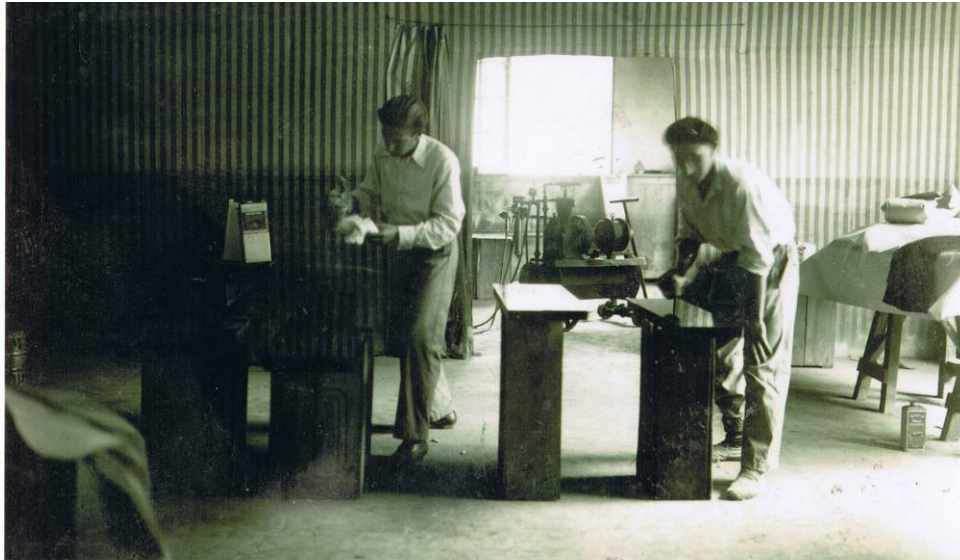
Azken urteetan, arbela pistolaz margozten zen.

Eskoletarako arbelen kasuan, egurrezko markoak egiten jarraitu zuten, eta, horretarako, lan hauek egiten ziren enborrekin: luzetarako ebakia zerrendako zerratan, lehortu, taulak zerratan ebakit, eta, azkenik, itxura eman, arrabotatzeko eta matxinbratzeko makinetan. Azken urte horietan, eskoletarako arbelen markoak modu automatikoan muntatzen ziren, bereziki helburu horretarako osatutako makinen bitartez 175 .