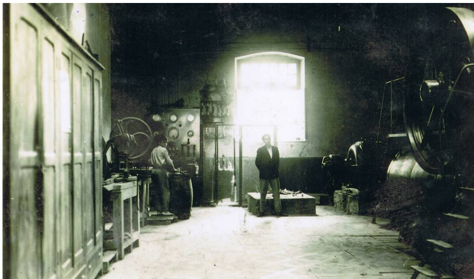
Zentral Etxea. ITSASONDOKO UDAL ARTXIBOA, sig. 329

eta arbelezko estalkia zituen. Hari itsatsita, solairu bakarreko biltegia zegoen, hormigoi armatuko estalki lauarekin, eta haren azpian zeuden gasogenoak eta zerrauts-biltegiak. Biltegi hori ibaia bideratzeko horma baten gainean zegoen bermatuta, Oria ibaiaren ertzean, hain zuzen ere.