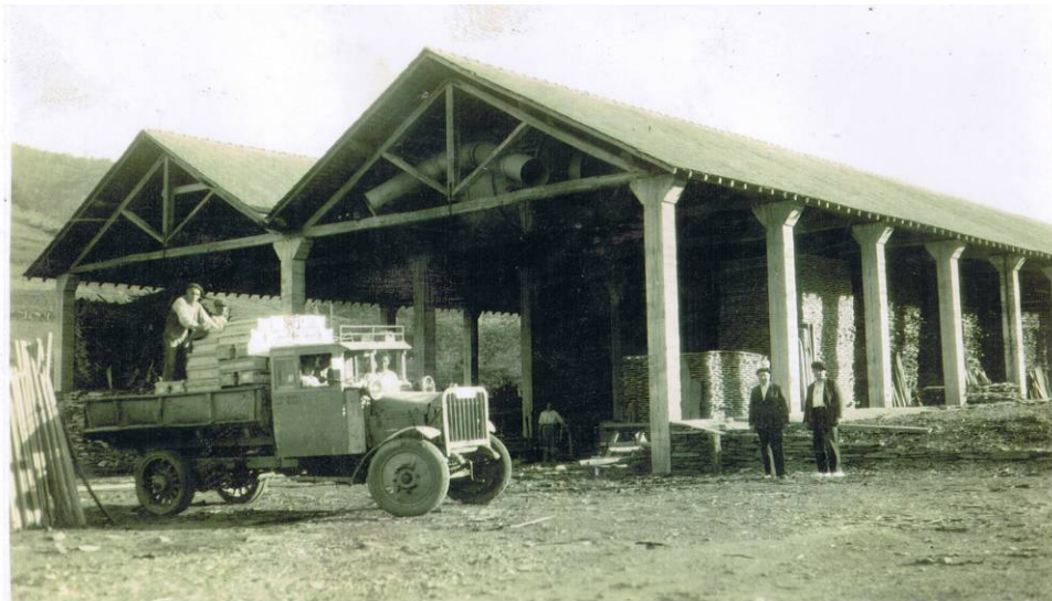
Sarasolatarren egur-biltegiak. ITSASONDOKO UDAL ARTXIBOA, sig. 329

arduratzen ziren, eta emakumeak, berriz, azken ebakiak egiteaz, eta baita arbela lisatzeaz eta leuntzeaz ere. Lehenengo lanak aipatutakoen antzekoak ziren: lehenik, harria ebakitzen zen, zerra mekaniko handi batekin; eta bigarren zerrarekin, blokea behar zen neurrira ebakitzen zen. Horren ondoren, blokearen kontra jotzen zen, arbel-xaflak ateratzeko, eta hortzetatik pasatzen zen, beharrezko lodiera lortu arte 168 . Gero, lixatu eta hareaz leuntzen zen. Langile gazteenek egiten zuten lan hori, eta xaflari behin betiko neurria ematen zitzaion, guraize handi batzuen laguntzaz. Azkenik, geruza berezi bat ematen zitzaion arbelari, arabiar gomaz: goma hori tabletatan iristen zen tailerrera, eta uretan irakinarazten zen, mokor bat lortzen zen arte. Goma mokor horrekin igurzten zen arbelaren gainaldea, eta bernizatuta bezala gelditzen zen; ezin hobeto gelditu zedin, arbela xareta baten gainean lehortzen zen 169 .